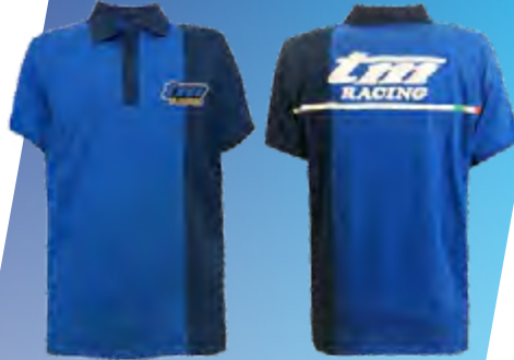
POLO / POLO SHIRT COD. 95359