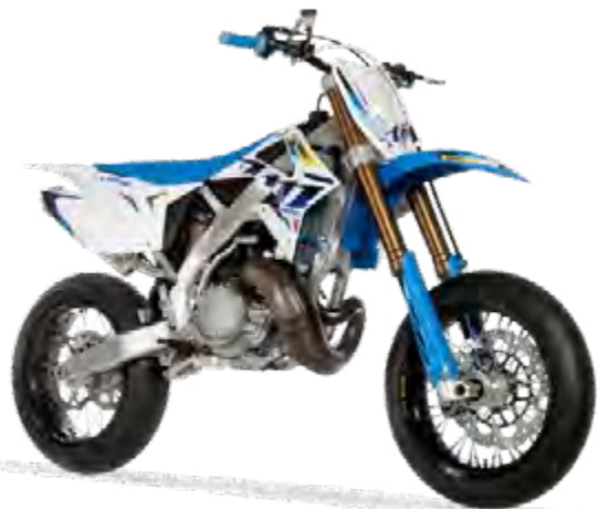
SMX 250 ES