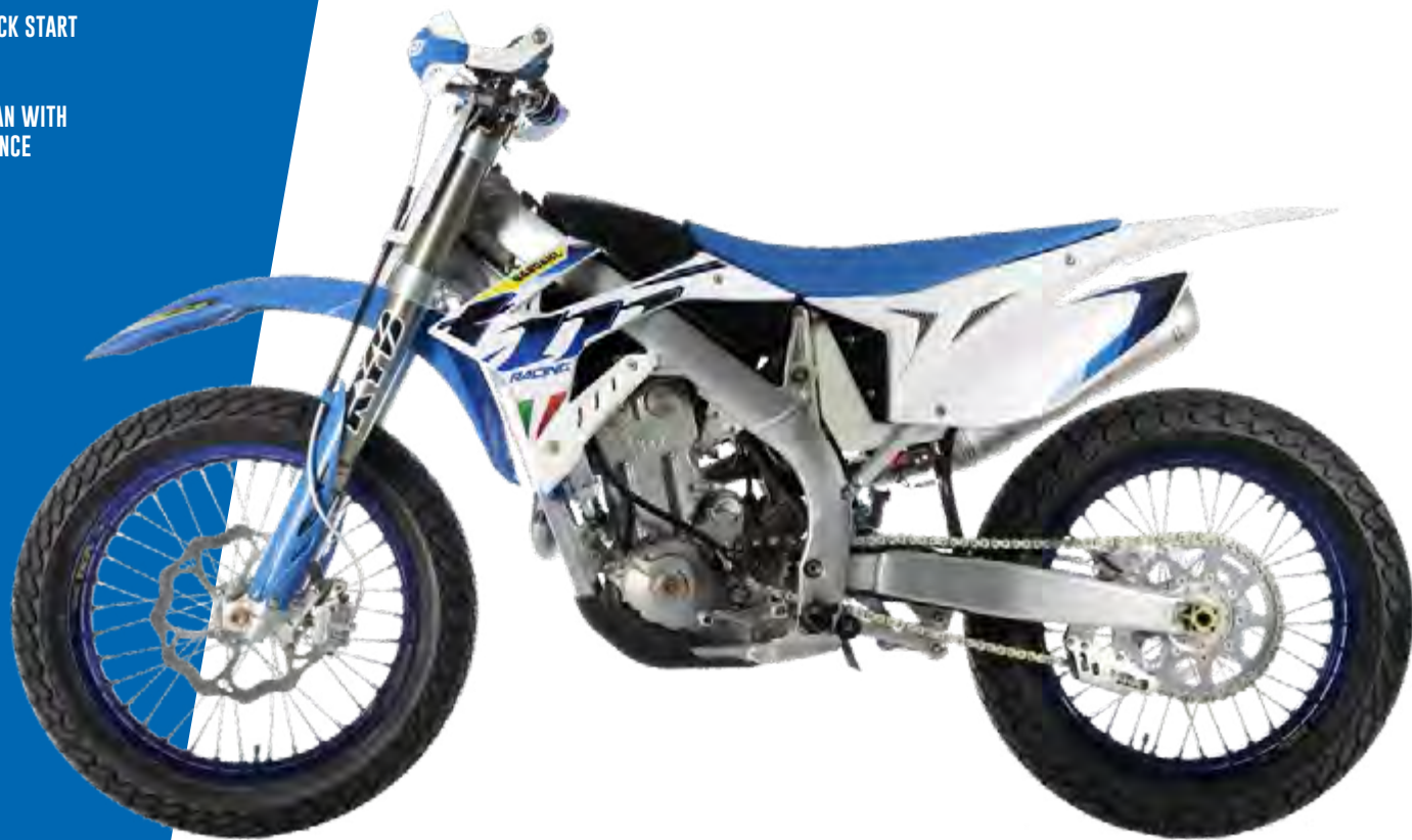
FT 530 Flat Track

ENGINE: SINGLE CYLINDER 4 STROKE DISPLACEMENT: 449,4 CC STARTING: ELECTRIC AND KICK START GEARBOX: 5 SPEED TANK: 7,5 LT. PLASTIC IGNITION: ELETTRONIC KOKUSAN WITH VARIABLE CDI ADVANCE ECU EMOTICOM