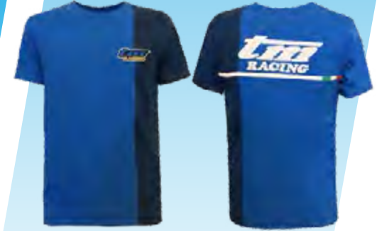
T-SHIRT COD. 95362