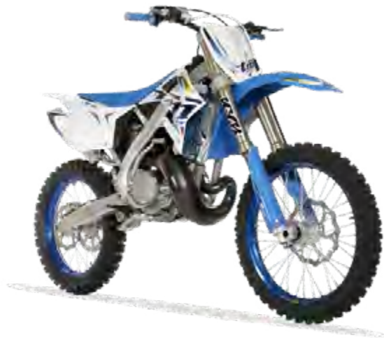
MX 250 ES