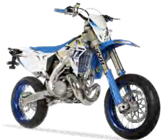
SMR 250 Fi