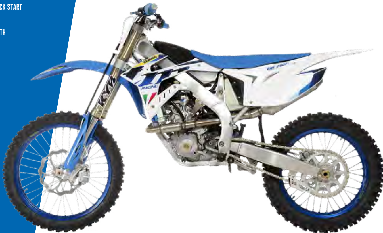
MX 300 Fi

ENGINE: SINGLE CYLINDER 4 STROKE DISPLACEMENT: 249,6 CC STARTING: KICK ELECTRIC AND KICK START GEARBOX: 6 SPEED TANK: 7,5 LT. PLASTIC IGNITION: ELETTRONIC KOKUSAN WITH VARIA LE CDI ADVANCE ECU EMOTICOM