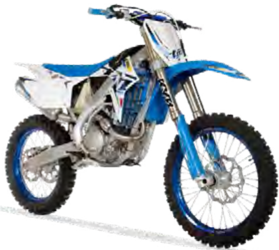
MX 530 FI