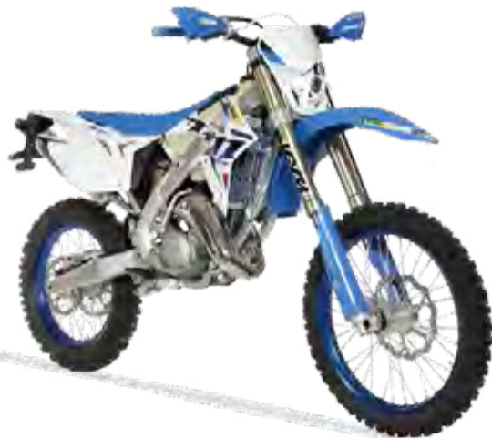
EN 144 Fi