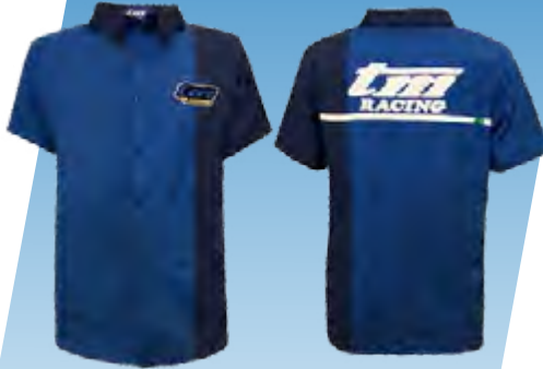
CHEMISE / SHIRT COD. 95361