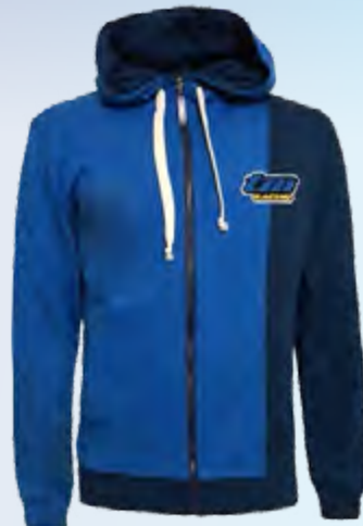
VESTE CAPUCHE HOODIE COD. 95360