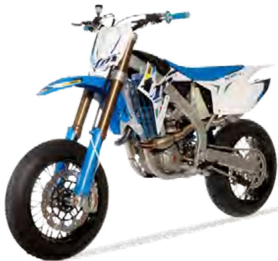
SMX 250 FI