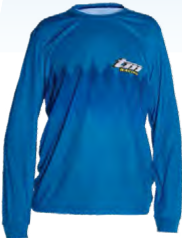
T-SHIRT MANCHES LONGUES LONG SLEEVED T-SHIRT COD. 95347